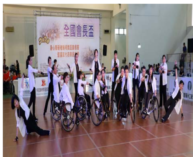
伊甸社會福利基金會輪椅舞蹈團