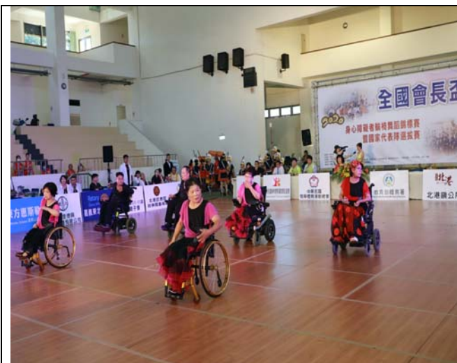
屏東脊隨損傷者協會