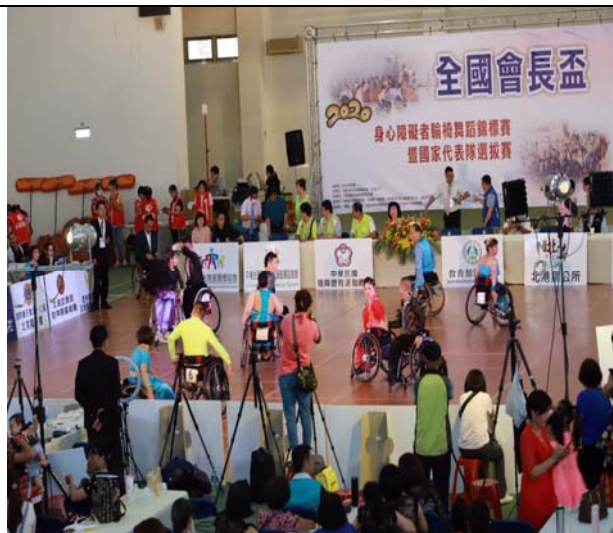
雙輪椅拉丁舞 5 項組