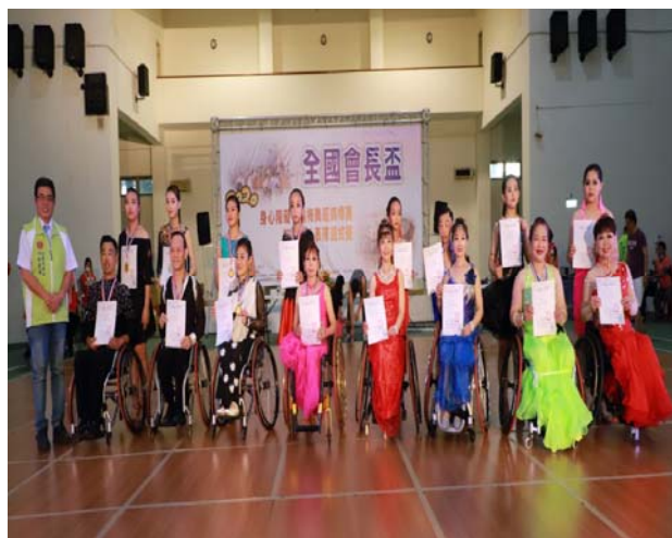
輪椅拉丁舞選手 5 項組頒獎