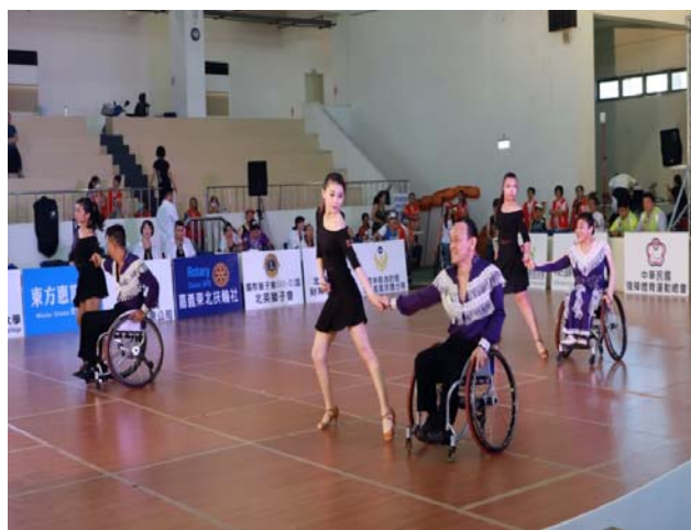
苗栗展夢園輪椅舞集