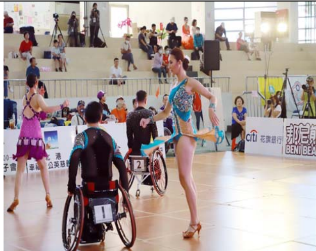
輪椅拉丁舞 5 項組