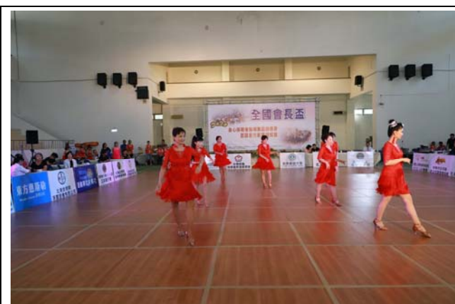
社團表演:雲林平原社區大學