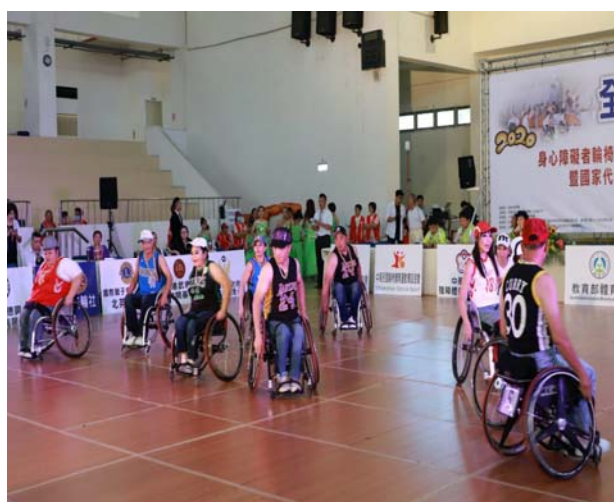
新北市樂活大學輪椅街舞