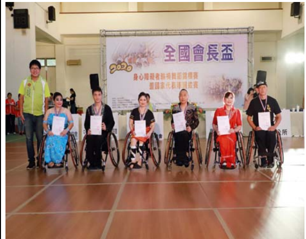
雙輪椅舞 10 項組頒獎