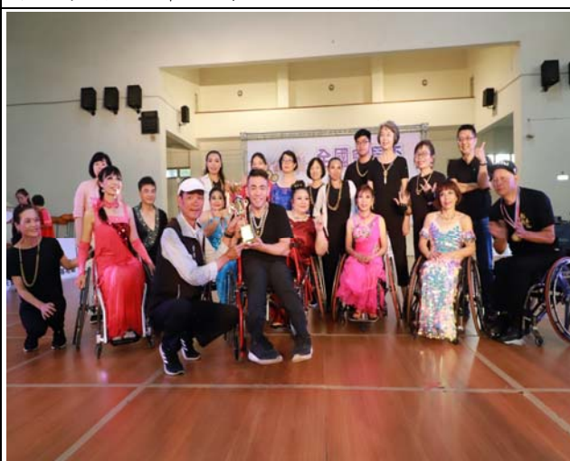
輪椅團體舞組第三名頒獎