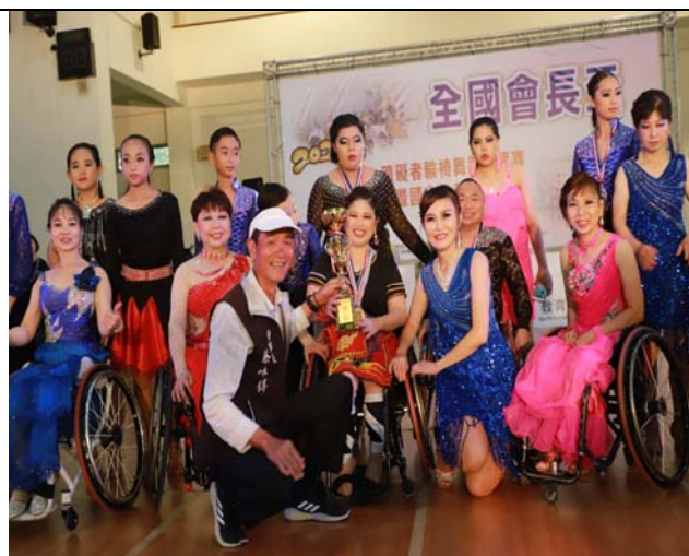
輪椅團體舞組第二名頒獎