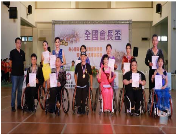
輪椅拉丁舞志工 2 項組頒獎