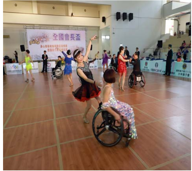
輪椅拉丁舞志工 5 項組