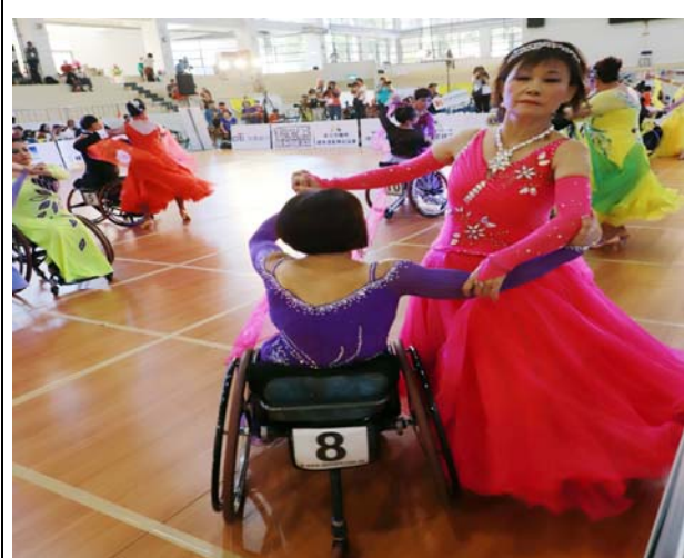
輪椅標準舞志工 5 項組