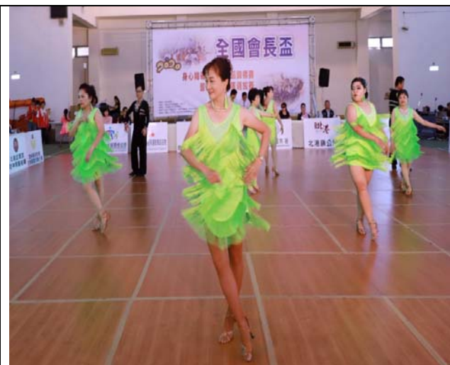
社團表演:雲林海線社區大學