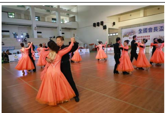
社團表演:雲林海線社區大學