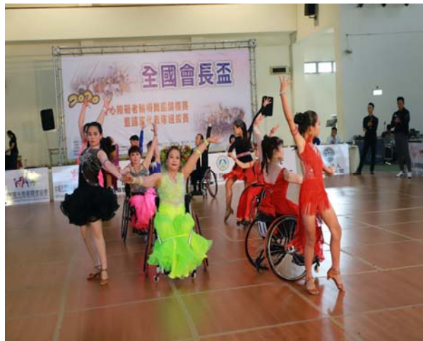
輪椅拉丁舞國小 3 項組