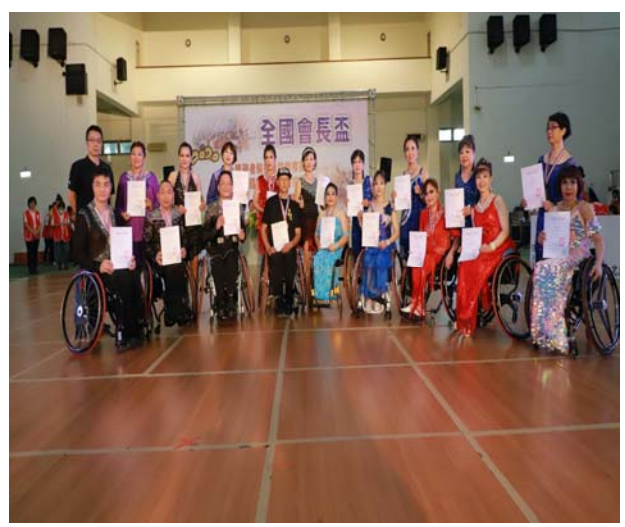
輪椅拉丁舞志工 3 項組頒獎