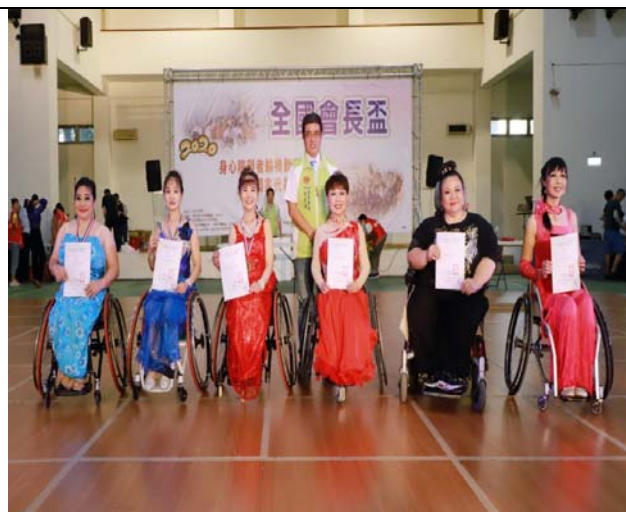
輪椅拉丁舞單人女生組頒獎