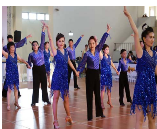
社團表演:雲林海線社區大學