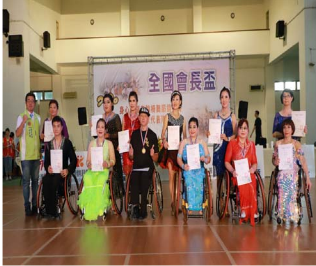
輪椅標準舞志工 3 項組頒獎