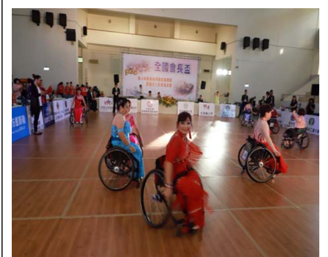
輪椅拉丁單人舞女生組