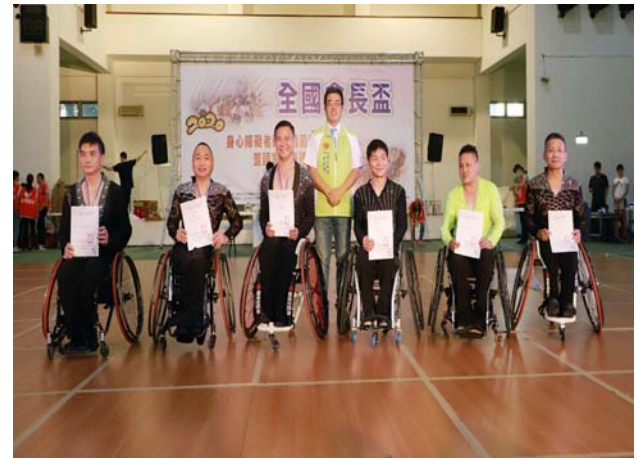
輪椅單人舞男生組頒獎