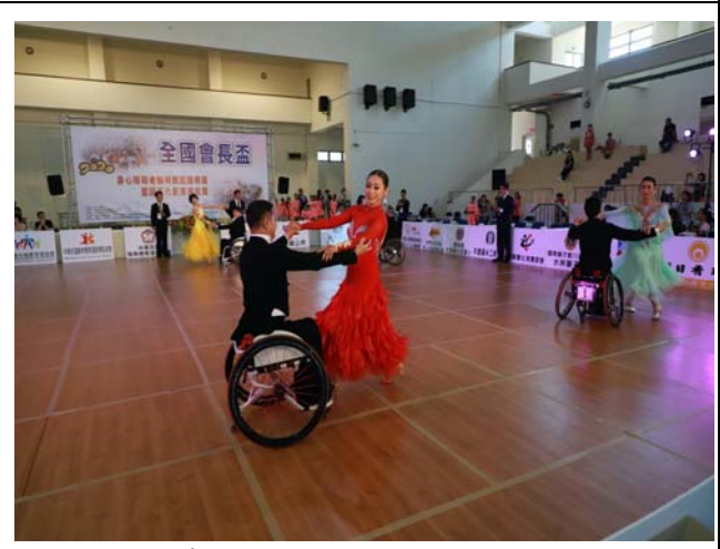
輪椅標準舞 5 項組