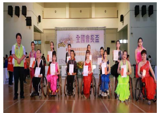
輪椅拉丁舞國小、中 5 項組頒獎