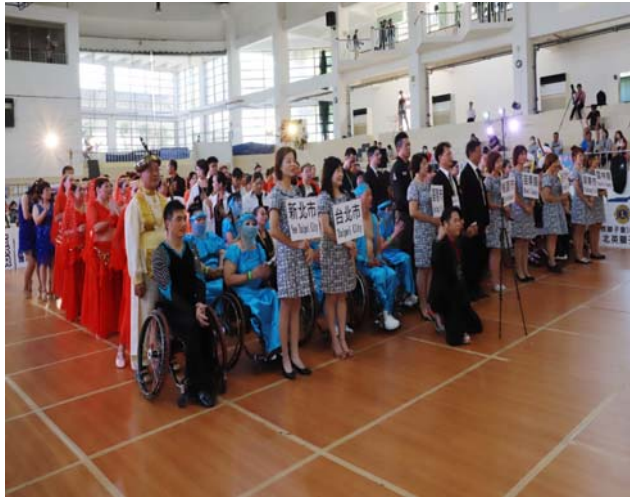
直播員進行開幕長官致詞直播