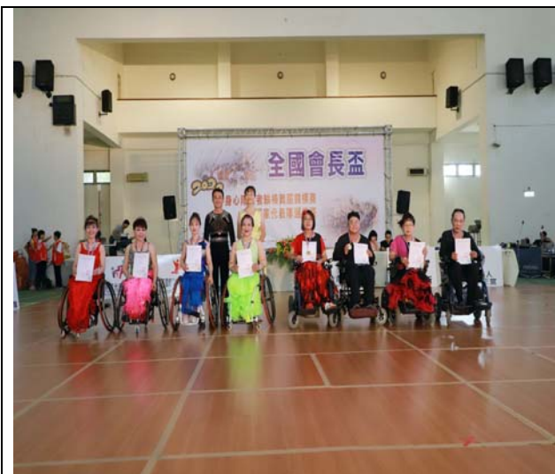
雙輪椅拉丁舞 2 項組頒獎