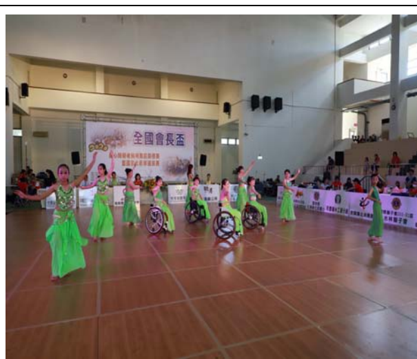
中華民國輪椅體育運動舞蹈協會