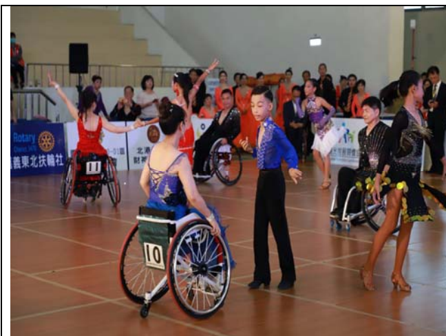
國小拉丁 3 項組