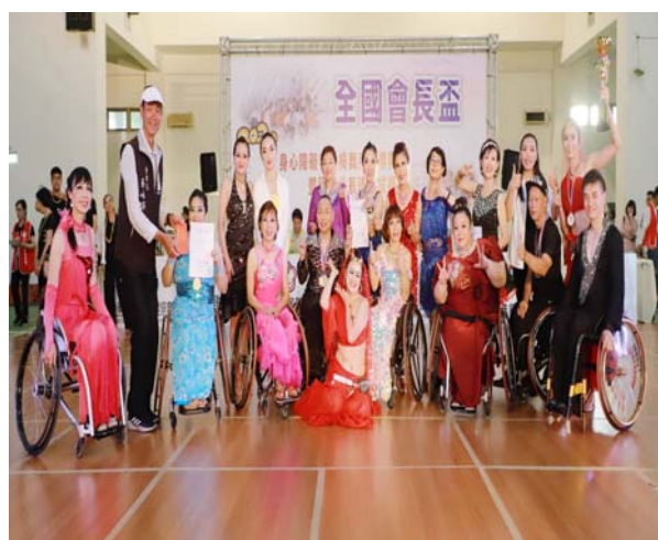
輪椅團體舞組第一名頒獎