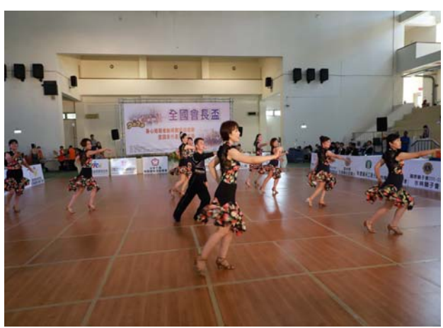
社團表演:台南白河虎山社區發展協會