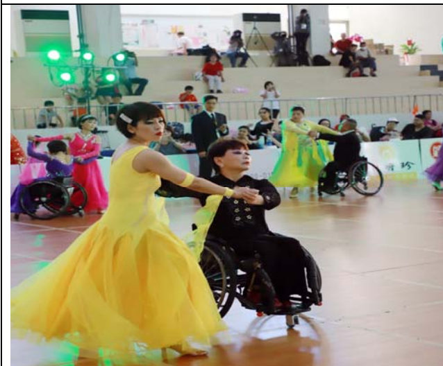
輪椅標準舞志工 2 項組