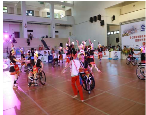
雲林縣海線社區大學輪椅舞蹈班