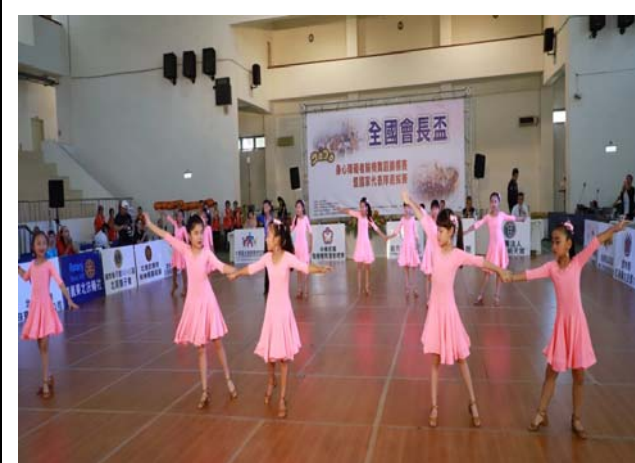
社團表演:北港鎮北辰國小拉丁舞班