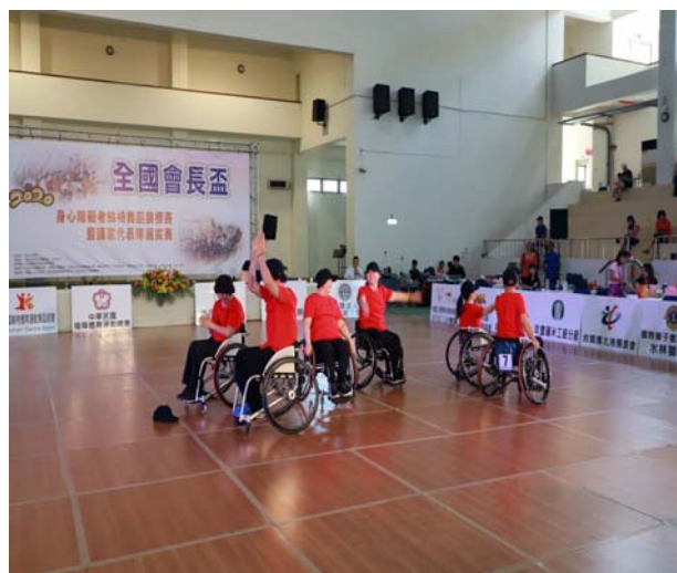
桃園任鵬飛輪舞集