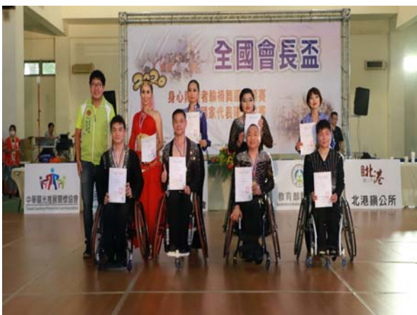
輪椅舞 10 項組頒獎