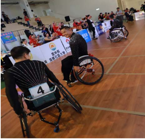
輪椅單人舞男生組