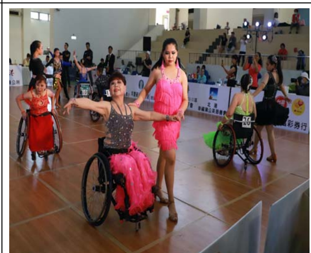
輪椅拉丁舞國小、中 5 項組