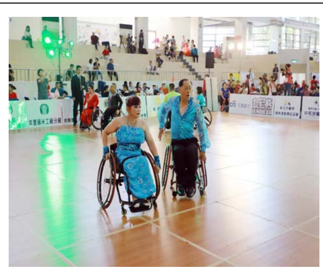
雙輪椅拉丁舞 5 項組