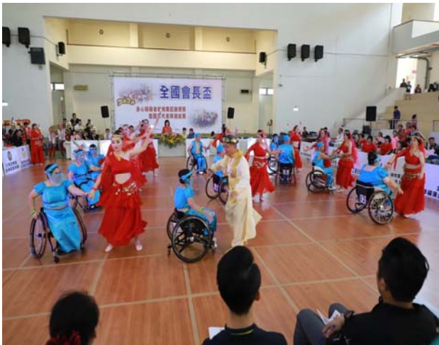
新北市輪椅體育運動舞蹈協會