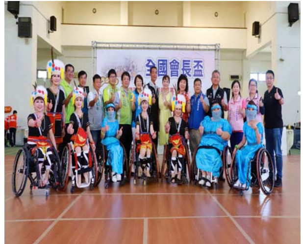
長官貴賓與參賽者合影