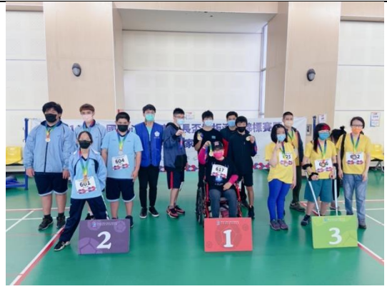
推廣體驗組團體賽頒獎