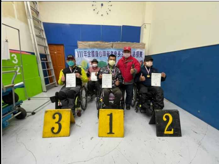
頒獎-複合弓男子組