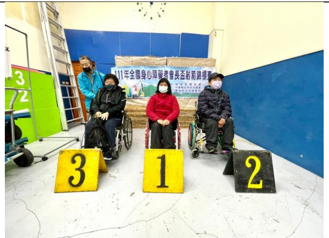
頒獎-複合弓女子組