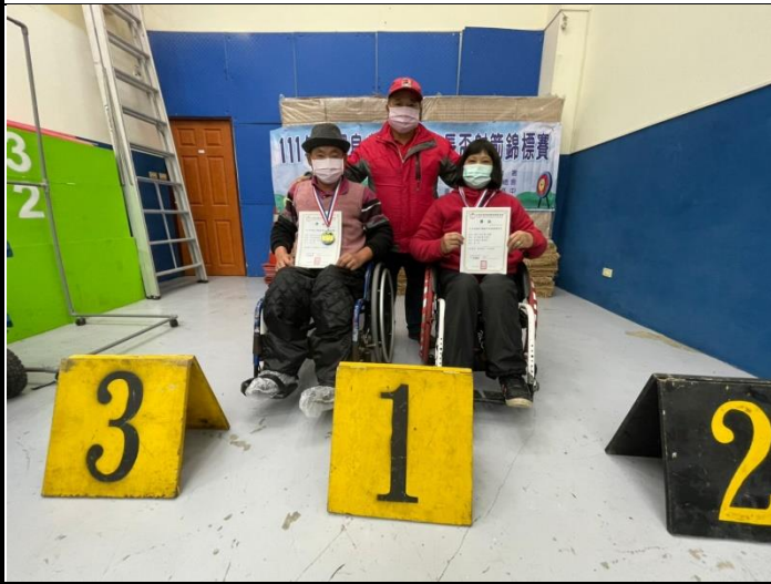
頒獎-複合弓混和雙人組