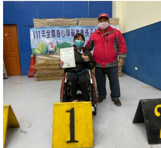
頒獎-反曲弓女子組