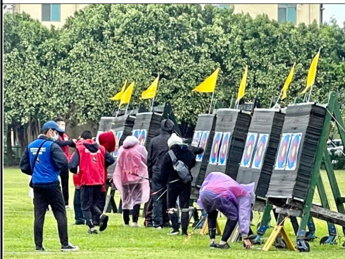
裁判與志工人員協助計分