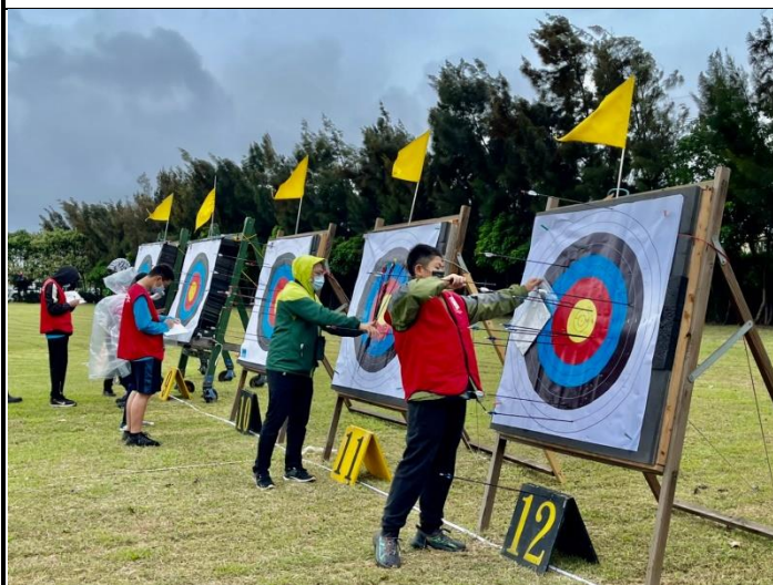
志工人員協助拔箭