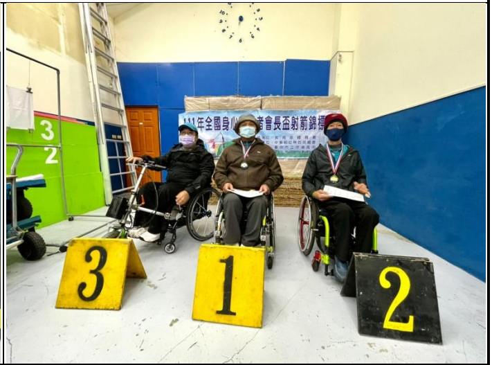
頒獎-反曲男子甲組團體組