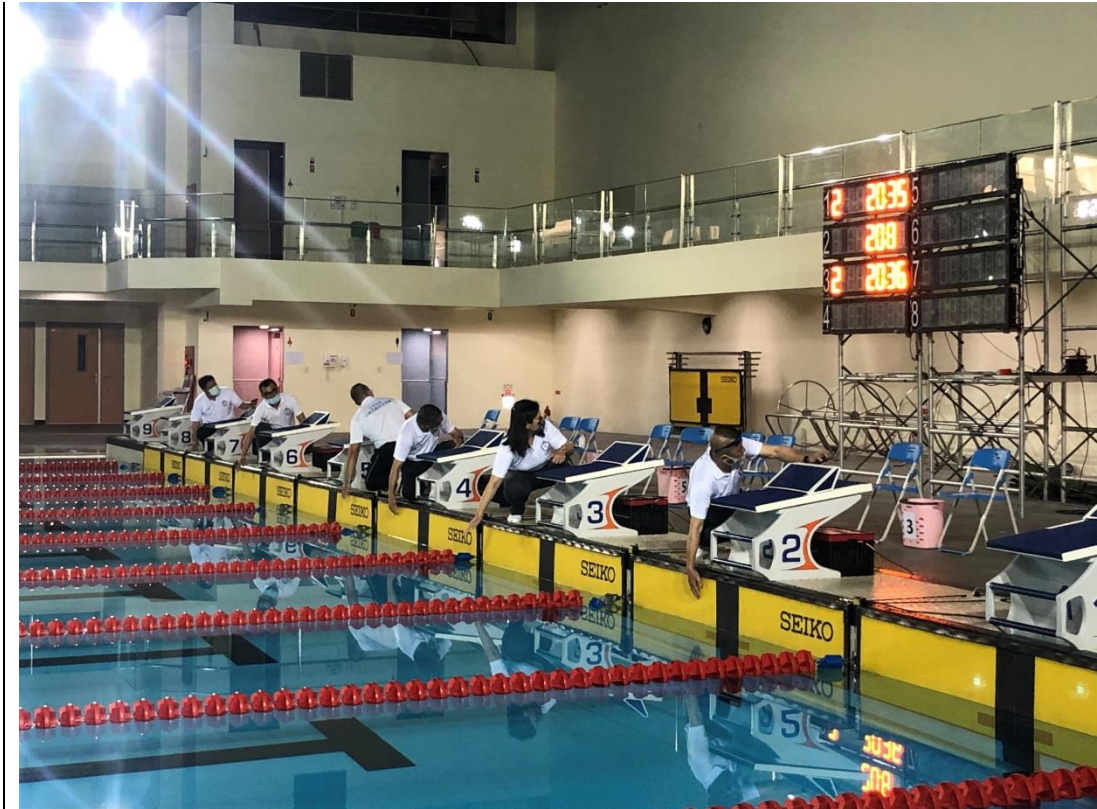
裁判前置測試準備