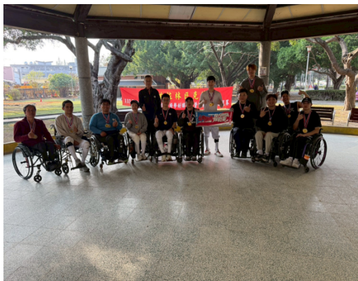
林委員與得獎者合影