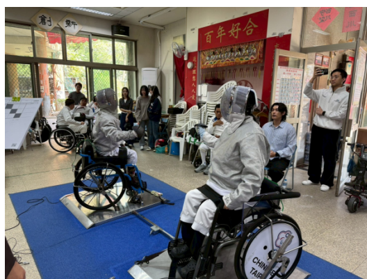
男子軍刀個人比賽