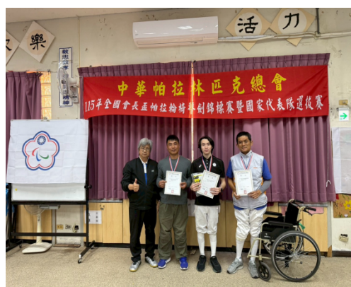
張召集人與得獎者合影