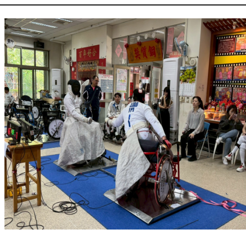
男子銳劍個人比賽