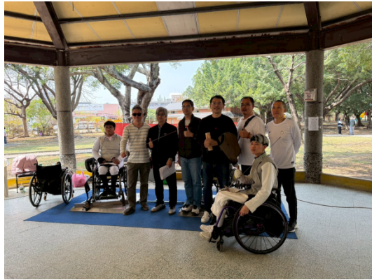
委員們與得獎者合影