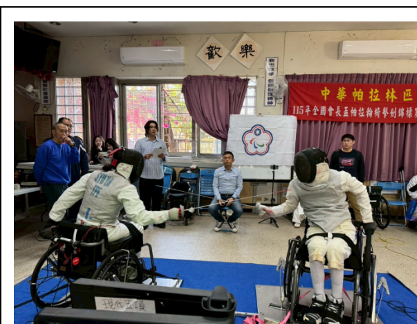
男子鈍劍個人比賽