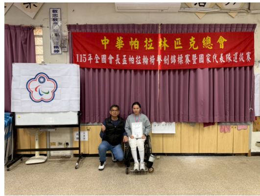
王委員與得獎者合影