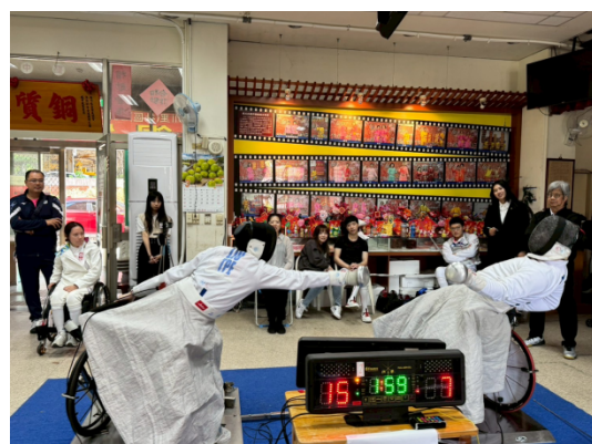
男子銳劍個人比賽