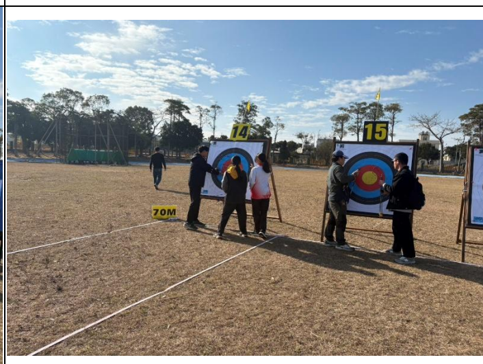
志工人員幫忙選手拔箭