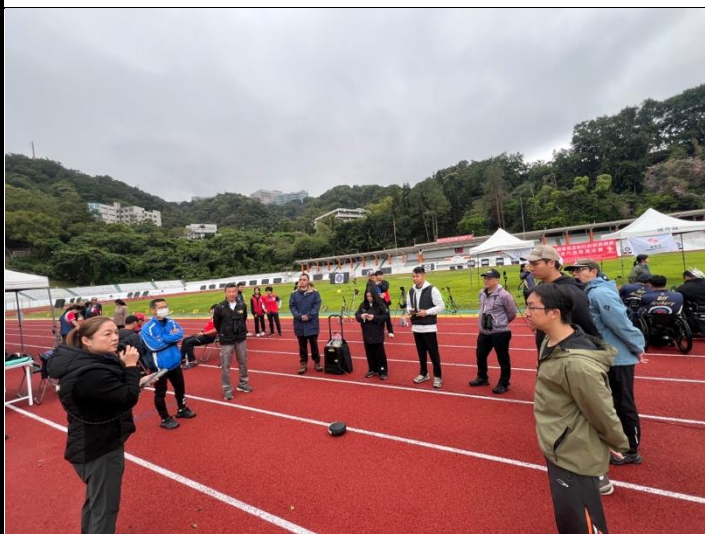
裁判長召開領隊會議