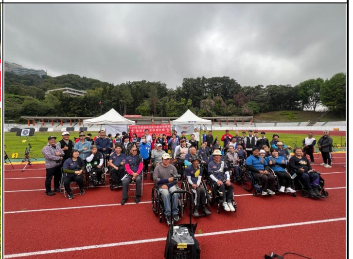
開幕典禮-長官們與選手合影