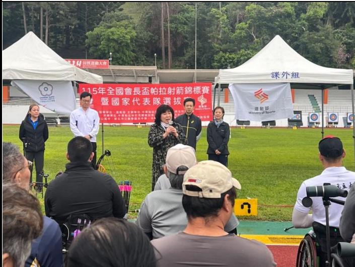
開幕典禮-穆會長致詞