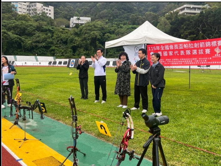
開幕典禮-介紹貴賓們