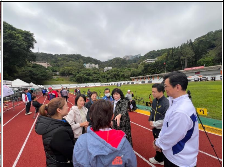
與運動部委員介紹貴賓們