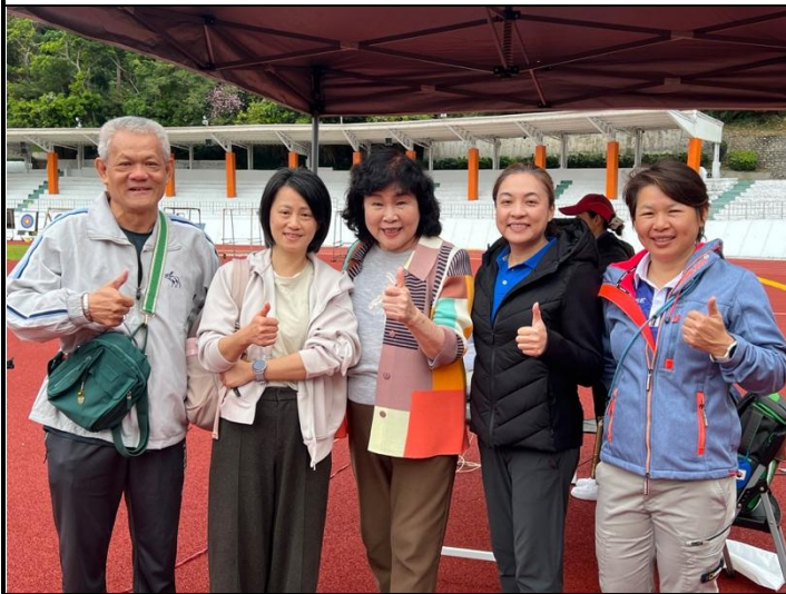
運動部委員訪視與貴賓們拍照合影