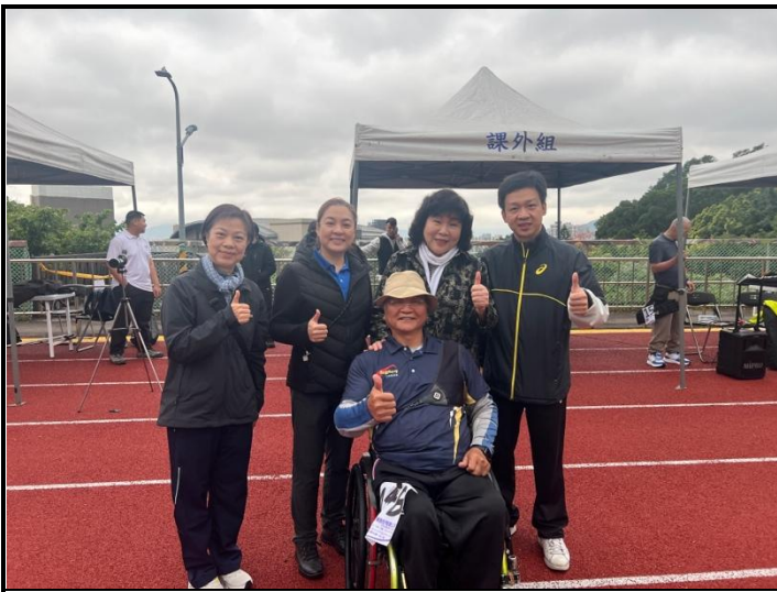
會長及長官們勉勵及關心選手