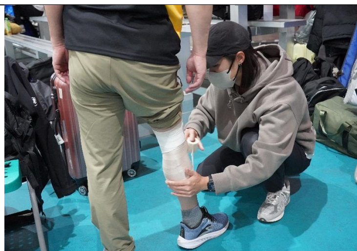
防護員協助運動員預防性貼紮