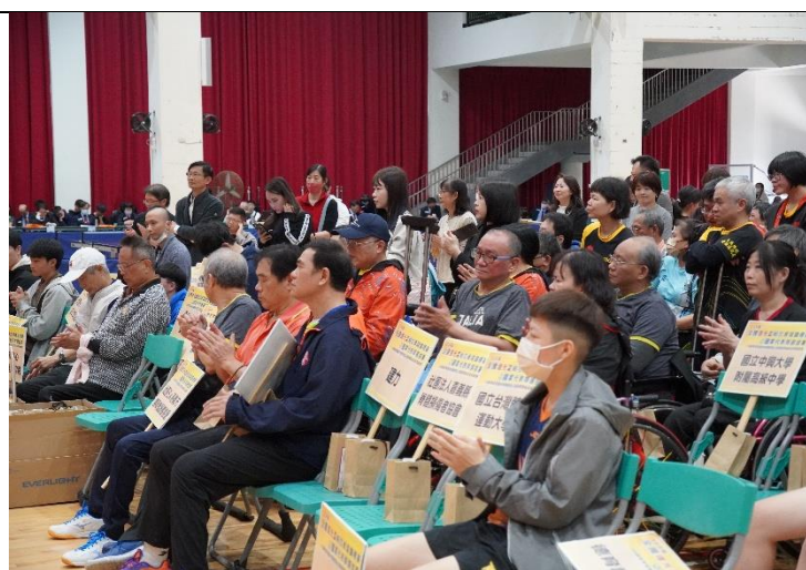
開幕典禮-選手集結側拍