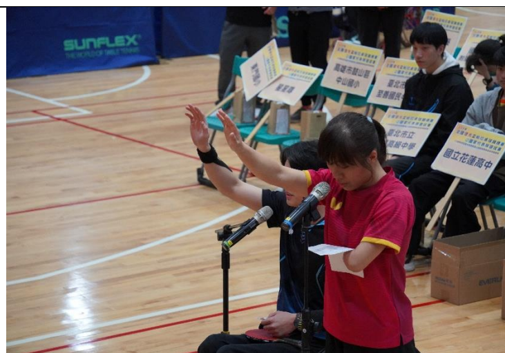
開幕典禮-運動員宣誓