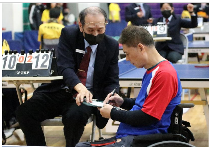
賽後確認比賽結果